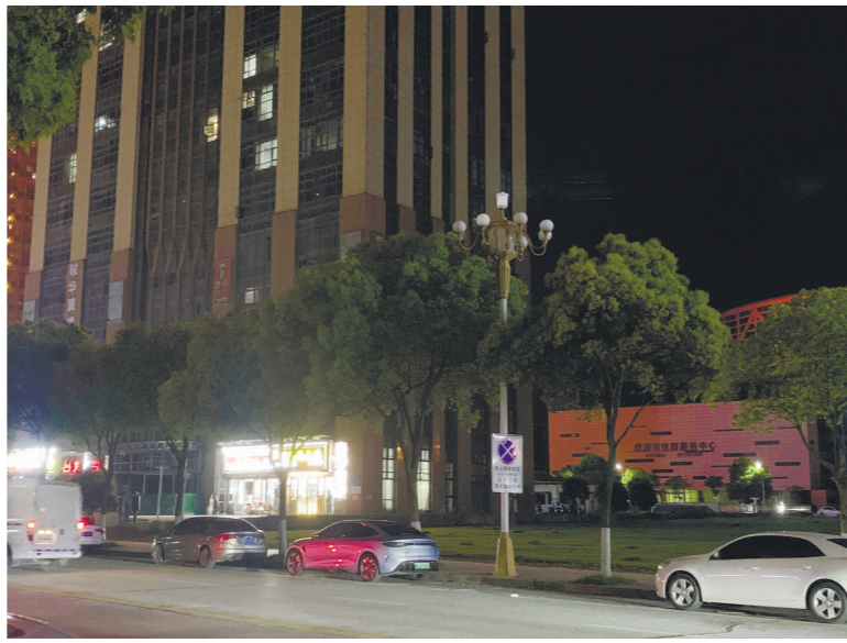
信江新区旺埠路路灯“失明”。

走访中,各路段附近的居民均表示,希望有关部门能够尽快维修好路灯,点亮周边道路,让大家不再“摸黑”行走。