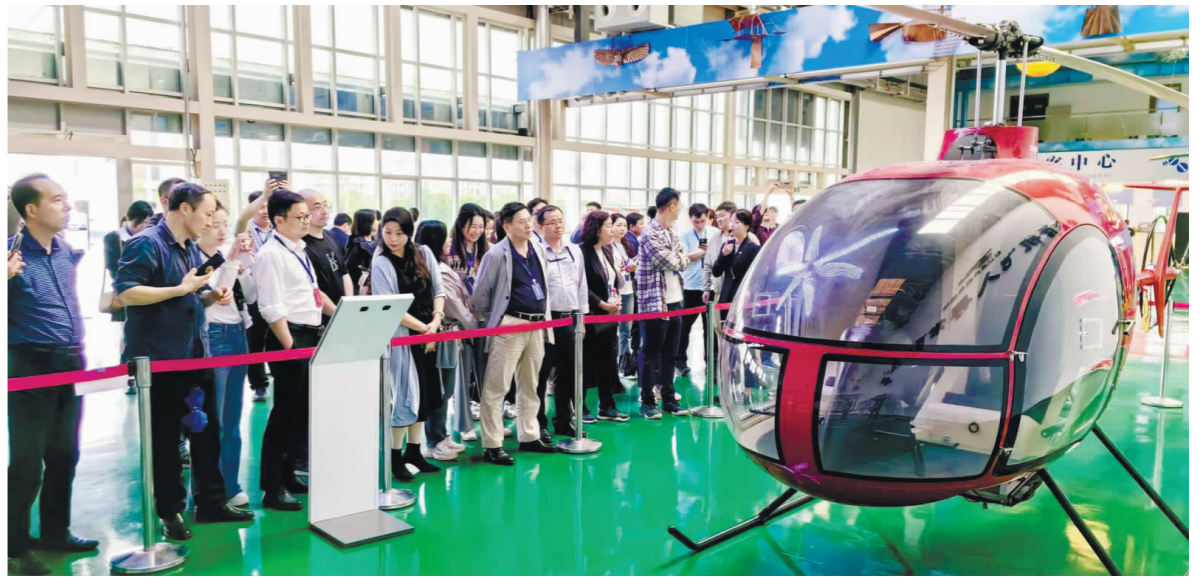
在江西直升机科技馆参观采风

被震撼到了，爱上了景德镇！4月15日至16日，由江西省报业协会、中共景德镇市委宣传部联合主办，景德镇市融媒体中心、景德镇新闻传媒集团承办，昌南里长天酒店协办的2024“媒景共融 如瓷美好”合作交流暨“百家媒体看瓷都”采风活动在景德镇举行。来自全国各地的100余名媒体嘉宾和记者走进景德镇，把目光和笔触对准景德镇，全方位领略景德镇美景、多角度感知陶瓷文化、深层次了解景德镇发展，在关注景德镇、宣传景德镇、支持景德镇中为把“千年瓷都”这张靓丽名片擦得更亮而增光添彩。