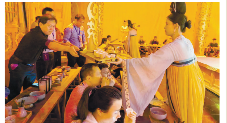
在高岭中国村大唐茶市品茗